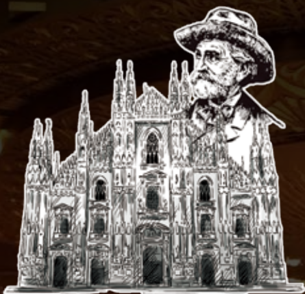
INTERNATIONAL FESTIVAL GIUSEPPE VERDI OF MILAN

International Festival Giuseppe Verdi of Milan 2019