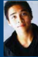
Miclén, Pang Lai USA 美國 The Colburn School of Music 美國科爾伯恩學院